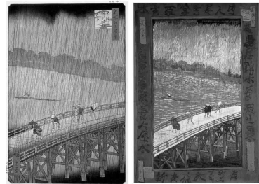
[그림 2] 우타가와 히로시게, '오하시아타케의 소나기' (좌)와 반 고흐, '일본풍 :빗속의 다리'(우)

동양에 대한 막연한 동경을 벗어나 하나의 사조로서 자리 잡을 수 있게 해준 자포니즘의 대표적인 우키요에는 유럽의 다양한 예술분야에 영향을 주기 시작했다. 프랑스의 '인상주의(impressionism)' 화가들은 이러한 우키요에의 색채와 구도를 적극적으로 받아들인 대표적인 예이다. 마네(E. Manet)와 모네(C. Monet) 그리고 후기의 반 고흐(Vincent Willem van Gogh) 등의 회화에서 우키요에의 영향은 [그림 2]와 같이 쉽게 찾아볼 수 있다.