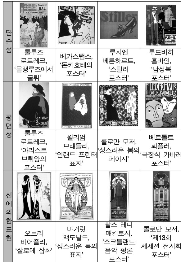
[표 1] 우키요에의 특성과 그 영향

그림 출처: 필립 B.맥스.(2002). 그래픽디자인의 역사. 황인화 옮김. 서울: 미진사.