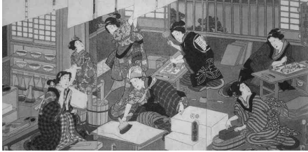
[그림 3] 우타가와 구니사다, ‘우키요에 판화 공방의 모습’

능했다. 우키요에의 밑그림을 그리는 화가인 ‘에시(繪師)’와 판화의 조각사인 ‘호리시(彫師)’, 그리고 인쇄사인 ‘스리시(摺師)’ 등의 기술자들을 포함하여 이 모든 인원이 갖추어져야지만 제작이 가능했다. 이것은 완벽한 분화에 의한 공정이었으며, 한 사람에 의해 제작되어지는 예술품과는 다른 의미의 것으로서, 우키요에만의 특성인 것이다.