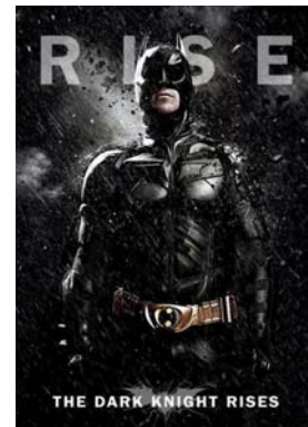
좌: [그림 9] 숭고미를 표현하는 배트맨의 케이프 (배트맨 비긴즈, 2005) 9)