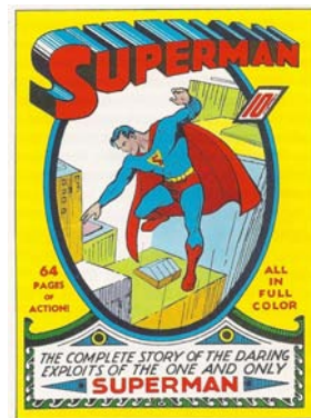
[그림 1] 1939년 슈퍼맨 만화책의 표지 1)

니폼을 착용하는 것이 슈퍼히어로의 필수조건이 되었다. 1950년대에는 청소년범죄 유발매체 논란에 이른 검열과 장르나 소재의 결핍으로 만화가 큰 위기를 맞았다. 그러나, 슈퍼맨은 TV 시리즈로 제작되는 등 여전히 인기를 누렸고, 슈퍼맨, 배트맨을 만들어낸 미국 만화제작회사인 DC 코믹스(DC Comics)의 경쟁사가 되는 마블 코믹스(Marvel Comics)가 1961년 판타스틱 4(Fantastic 4)를, 이어 스파이더맨(Spider-Man), 엑스맨(X-men), 데어데블(Daredevil) 등을 내놓음으로써, 미국 만화업계는 DC 코믹스와 마블 코믹스의 경쟁적 구조 안에서 성장하게 되었다.(김기홍, 2005)