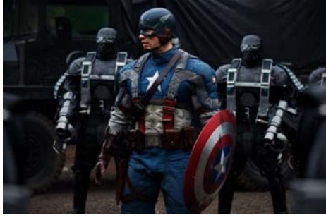
[그림 11] 미국적 상징미를 가장 많이 보여주는 캡틴 아메리카(캡틴 아메리카: 퍼스트 어벤저, 2011) 11)