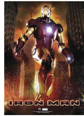
좌: [그림 5] 아이언 맨의 평상시 모습(아이언 맨, 2008) 5)