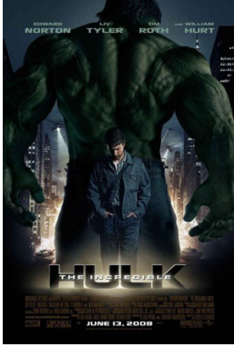
[그림 2] 과장된 인체미와 남성적 우월함을 보여주는 헐크(인크레더블 헐크, 2008) 2)