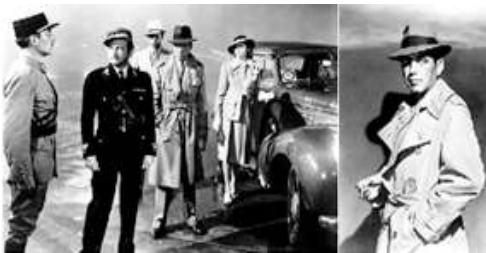
[그림 21] 트렌치코트 출처: 영화정보: 카사블랑카(1942)

제1차 세계대전동안에 군인들에 의해 입혀진 밝은 브라운 색상의 오리지널 트렌치코트의 창조자는 브랜드 'Burberry'였다. 전쟁이 끝난 후 이 트렌치 또한 트렌치 스트라이프, '카멜레온'이라 불렸다. 험프리 보가트(Humphrey DeForest Bogart)가 영화에서 코트의 깃을 세우고 허리띠를 동여매는 스타일로 탁월한 '멋스러움'을 자아내어 트렌치코트를 우상적인 존재로 만들었다[그림21]. 트렌치코트가 여성모드로 도입되면서 다양한 패션의 해석이 디자인되었으며, 디자이너 컬렉션의 현실적인 다양한 변형을 통해, 트렌치는 화려한 색상과 패턴으로, 또는 미니로 나타나기도 한다 (김정실, 2011)[그림22-23].