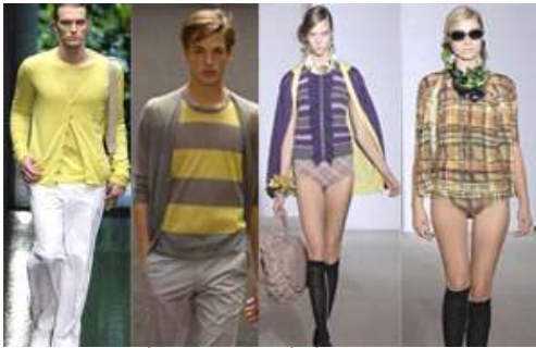
[그림 31-34] 트윈세트(Twin set) [그림31] '05SSKrizia [그림32] '07SSRykielHomme [그림33] '09SSMarni [그림34] '09SSMarni

코코샤넬은 '샤넬 슈트'이외에 그녀가 후세의 여성들에게 남긴 가장 중요한 패션 혁명으로 'Little Black Dress (작은 검정 드레스)'를 들 수 있다[그림 35-36]. 20년대 초에 그녀가 이 옷을 고안해 낸 후, 이 검정드레스는 수십 년의 20세기의 각테일파티 의상이나 이브닝드레스의 우상으로 발전된 동시에, 시대를 불문하고 가장 빈번히 카피되는 의상이다[그림 38-39]. [그림37]의 의상 디자인의 최신버전은 팬티스타킹과 떼었다 붙였다 할 수 있는 멜빵이 달린 신축성 있는 드레스로서 필요에 따라 미니 또는 맥시형 드레스로 변신가능하게 패턴을 전개하였다.