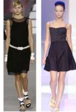
[그림38] '05SS,Celine [그림39] '05SS, Chanel