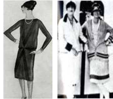
[그림 2] [그림 3]