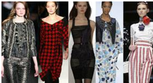
[그림 41] 클래식소재와 패턴디자인

'05FW '06FW '07 FW '09SS '09SS Donna Karan, Preen, Issa, D&G