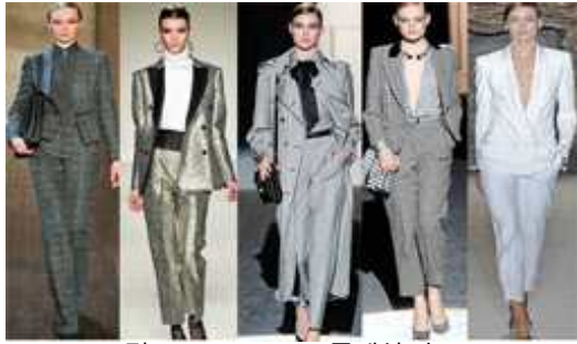
[그림 43] '10-'11SS 클래식 슈트 EmporioArmani, GiorgioArmani, Gucci, MaxMara, Sport Max