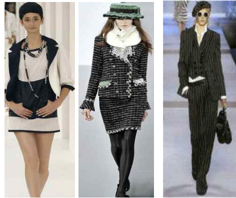
[그림14]'07SS [그림15] '09FW [그림16]'09FW Chanel Suit's