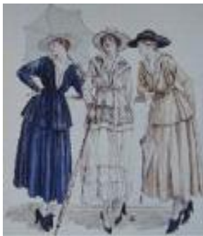
[그림 13] 19세기말 여성복식

클래식 패션에서 현대적 적용의 대표적인 예로 최근 패션에서 칼 라거펠드(Karl Lagerfeld)는 샤넬의 클래식한 스타일을 새로운 소비자와 새로운 시대의 분위기에 맞는 실루엣으로 재창조하여 샤넬의 이미지를 이어가고 있다. 이것은 디자인의 영감을 샤넬의 전통에서 받아 자신의 천재적인 재능과 상상력이 더해진 결과로 그는 샤넬의 기본 디자인을 그대로 고수하면서 현대의 패션요소를 가미하여 현대 패션을 리드하고 있다. 그가 소재로 사용한 트위드와 장식적인 브레이드[그림15], 금단추 등은 샤넬의 트레이드마크인 요소의 사용이며, 또한 전통적인 샤넬 슈트에 캐주얼한 블루진 코디[그림17]는 클래식과 현재를 조화시킨 획기적인 제안이라고 볼 수 있다