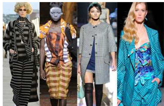
[그림 46] '10-'11SS 클래식소재와 패턴디자인 Chanel, VivienneWestwood, Marc Jacobs, Salvatore Ferragamo