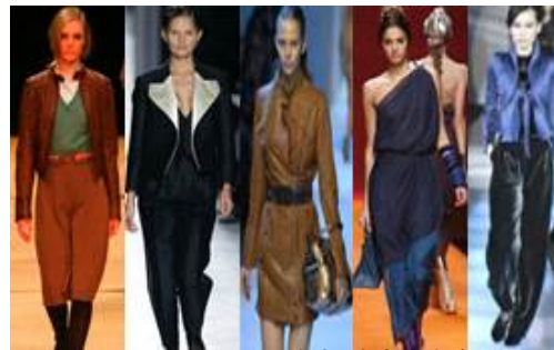
[그림 40] 클래식 색상디자인 06'FW 07'FW 07'FW 08'SS 08'FW PaulSmith,YvesSaintLaurent,Trussardi,Hermes, Giorgio Armani