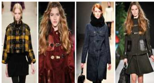
[그림 45] '10-'11 FW, Duffle Coat BurberryProrsum Mulberry Daks Mulberry