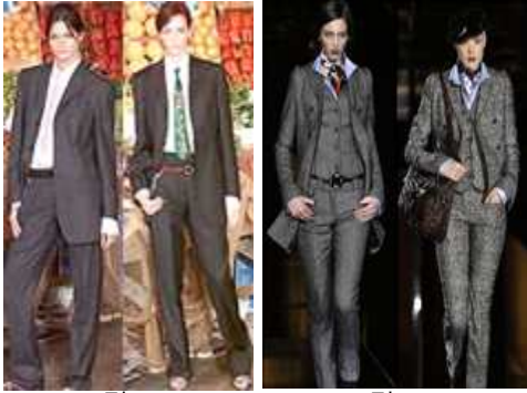
[그림 19] [그림 20] [그림 19] '00SS Dolce & Gabbana (pants suit) [그림 20] '08FW Dolce & Gabbana Collection