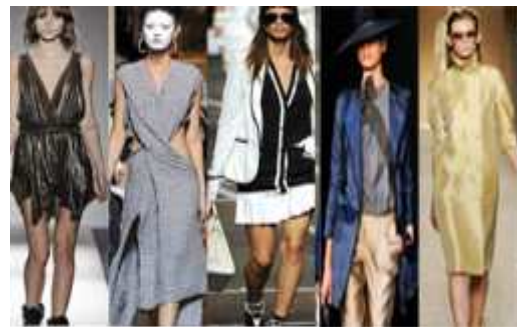
[그림 42] '10-'11SS 클래식&매니쉬

미래적인 구조와 하이테크의 기술을 접목하여 차별화되는 전통적인 클래식의 매니쉬를 믹스하였으며, 2010~2011년 현대패션에 나타난 클래식스타일의 실루엣은 전체적으로 슬림하게 인체의 자연스러움을 추구하는 것으로 나타났다[그림42]. 2010-11'SS시즌의 의상은 고대 그리스복식과 가디건 셔츠의 스타일이 재현하여 등장하였으며, 슬림한 실루엣과 앰파이어 스타일의 클래식 Men's wear 슈트가 재해석되어 등장하였다[그림43]. 2010-11'FW시즌의 의상은 밀란 패션위크의 키워드의 중심은 클래식 무드였으며, 클래식 남성 코트의 요소의 영감을 얻어 무릎길이, 직선적인 실루엣에 울 혼방, 스웨이드 소재를 활용하여 테일러링슈트와 더블코트가 등장하였다[그림44-45]. 시즌을 맞이한 패션하우스들은 이탈리아의 발달된 섬유산업이 바탕이 된 럭셔리한 소재와 우아하고 세련된 웨어러블(wearable)한 디자인을 제안하였다. 80년대 이후 디자이너들이 손에서, 자극적인 색상으로 고상하고 단정한 모습으로 뚜렷한 주관을 가지고 클래식 스타일을 선호한, 클래식 남성 코트의 요소의 영감을 무릎길이, 직선적인 실루엣에 캐시미어와 같은 소재와 플레이드, 플로랄, 도트, 소프트한 애니멀 프린트로 자유로운 감성의 클래식 스타일을 완성했다.