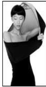
[그림 35] 오드리 햅번이 영화 '티파니에서 아침을'에서 little black dress착용 모습, 1961 [그림 36] '작은 검정 드레스'의 초현대적인 작품. 다기능적인 제2의 피부, 갇마른 여성을 위하여. [그림 37]울포드의필립스타크(WolfordPhilippeStarck) 디자인.