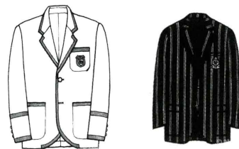
[그림 9] 블레이저(클럽) 재킷 (1920년대)

블레이저 재킷 [그림9]은 현대의 남성 및 여성패션에 있어서 결코 포기할 수 없는 구성요소이다. 거의 모든 행사장에서 입을 수 있으며, 재킷은 넥타이나 드레스 셔츠와 함께 공식적인 차림의 정장용, 그리고진(jeans)과 티셔츠 위에 걸치면 훌륭한 캐주얼웨어를 만들어 낸다. [그림10-12]에 나타난 클래식스타일의 블레이저 재킷은 클래식과 현재를 조화시킨 획기적인 제안이라고 볼 수 있다