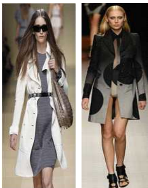
[그림22]'08SS(BurberryProrsum)[그림23] '08SS(Givency)