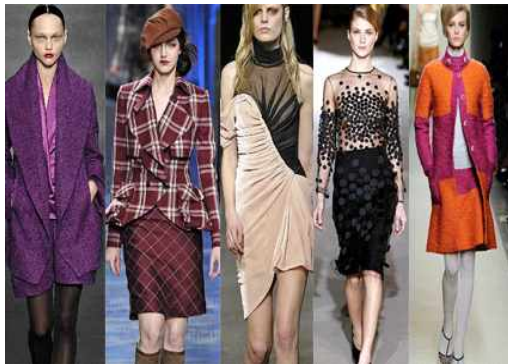
[그림 47] '10-'11FW 클래식소재와 패턴디자인 DonnaKaran, ChristianDior, AlexanderWang, McCartney Bottega Veneta