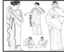
[그림 1] 히마티온 복식(그리스)

현대복식에서 고전적 미란 디자인의 단순성, 조화, 재단이 절제된 형태, 즉 구조적인 선이 약화된 형태로서 인체미를 자연스럽게 유지하는 스타일로 그의 기본양식은 그리스와 로마에서 유래된 것이다[그림1]. 물론 유행에 의하여 그리고 디테일의 변화에 의하여 약간의 변형이 수반되지만 전체적인 H실루엣이나 구조적인 디자인의 특성은 그대로 지속되기 때문에 계속 받아들여지는 속성이 있으며(김민자, 2004, p. 220.), 합목적성, 적합성, 실용성을 그 미적 가치로 하고 있다. 가브리엘 샤넬(Gabrielle Chanel)의 혁신은 1926년 미국 보그지를 통해 발표된 ‘작은 검은 드레스(Chanel’s Little black dress)와 샤넬 슈트(Chanel’s Suit)이다[그림2][그림3]. 이 중 샤넬 슈트는 근현대 패션사에서 볼 때 비교적 확고한 클래식 아이템이 되었으며, 이 시기의 입체파의 영향으로 채도가 낮은 색상을 추구하였던 그녀의 관심은 상복(喪服)이외에는 당시 여성복에 사용되지 않던 검정색으로 전이 되었다. 샤넬은 원색을 위주로 한 기존의 의상유행에 반대하여 검정색을 여성복에 과감하게 도입시킴으로써 보다 현대적인 이미지로 변모 시켰으며(채금석, 1995, pp. 442-444), 트위드 슈트, 가디건, 재킷, 저지 블라우스 등 수수한 차림을 주로 창작하였고 이는 일상복에서 부(富)의 노골적인 표현은 바람직하지 않다는 것을 인식한 최초의 디자이너로서(Michael and Ariane Batterberry, 1982, p. 286), 중요한 복식사적 의미를 시사한다. 복식에 대한 완벽성을 즐기는 것은 절대적인 단순성 안에서 구성되어지는 것이며, 20년대에 가시화되기 시작한 여성복의 단순한 실루엣은 그 시대에 표출되기 시작한 표현주의 예술의 ‘단순성’ 추구와 연관하여 생각해 볼 수 있다. 이와 같이 20세기에 들어 패션은 다양한 사회적 욕구와 문화적 변화를 배경으로 디자이너들의 의지가 반영된 새로운 방식으로 커다란 변화를 일으킨 시기였으며, 예술적 감각의 표출로 다양한 클래식 스타일을 형성하게 되었다.