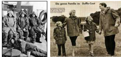
[그림 24] [그림 25] [그림 24]영국의 해군함대가 입고 있는duffle coat(1930) [그림 25] 부르다 패션 (Burda-modern) 1955년 9월호 '엄마는 온 가족을 위한 더플코트를 만든다'

1950년대에 유럽에서 더플코트는, 남녀 모두를 위한 최신 유행의 코트로서 붐을 일으켰고, 아동복에서도 인기가 많았다[그림25].