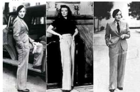
[그림 18] 1930년대 마리네디트리히 바지정장

바지 패션이 명품으로서의 명성을 얻게 된 30년대의 인기 영화배우 '마리네 디트리히'이다. 그녀 자신의 표현대로 '이미 반은 남자'였던, 남성적 이미지를 지닌 금발의 마리네의 바지 스타일은 몸에 꼭 맞는 형태, 강조된 허리, 폭이 넓고 곧은 바지라인은 여성적인 몸매를 극대화하였고, 완벽하지 않은 허벅지와 종아리를 감추기에 관대했다[그림18]. 90년대 말부터 현재까지 마리네 바지는 유니섹스-룩의 마리네의, 모든 유명 디자이너들의 컬렉션 속에서 리바이벌을 볼 수 있다[그림19-20]. 디트리히의 남성적인 스타일과 그녀의 꾸밈없는 바지는 수십 년 전부터 여성 패션에 있어 결코 유행이 지나지 않는 매력적인 룩으로 증명되고 있다.