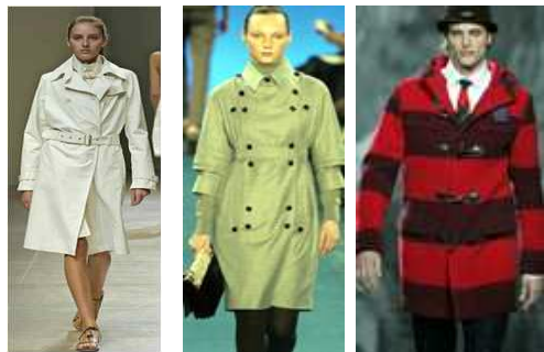
[그림 26-28] 더플 코트(Duffle Coat) [그림26]'05SS(JilSander)[그림27]'06FW YvesSaint Laure [그림28] '07 FW Tommy Hilfiger

[그림26-28]의 컬렉션은 소프트한 컬러와, 검붉은 레드로 생동감 있고, 심플하고 슬림하게 더플코트의 클래식 무드를 연출했다