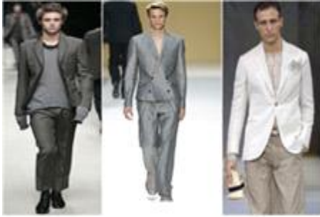
[그림 10] [그림 11] [그림 12]

[그림 10] '07SS, COSTUME NATIONAL, [그림 11] '07FW, Burberry Prorsum [그림 12] '08SS, Giorgio Armani