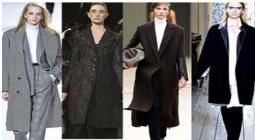
[그림 44] '10-'11FW, 클래식 슈트 Chloe, LouisVuitton, Celine, Balenciage